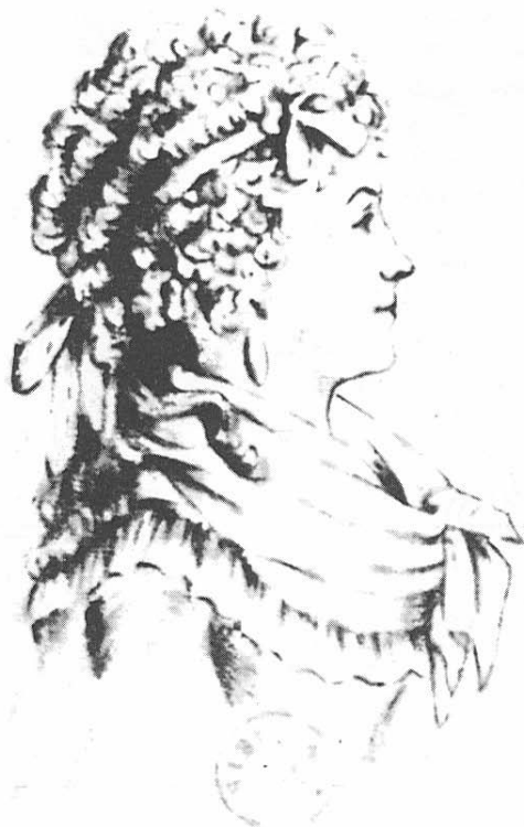
Renée-Pélagie, Marquise de Sade.

I slutningen af juni 1772 bliver Frankrig igen vidne til en skandale hvis ophavsmand er Marquis de Sade. Denne gang er det i Marseille. Marquis de Sade hyrer en håndfuld prostituerede til at gennemspille en fantasi. Bagefter bliver han anklaget for at have slået to af pigerne ihjel med spansk flue, et arsenik præparat der skulle give kvinder større lyst. Derudover er der de sædvanlige anklager om piskning, sodomi og et homoseksuel forhold til sin tjener. Efterhånden som sagen efterforskes, viser det sig at der er meget lidt