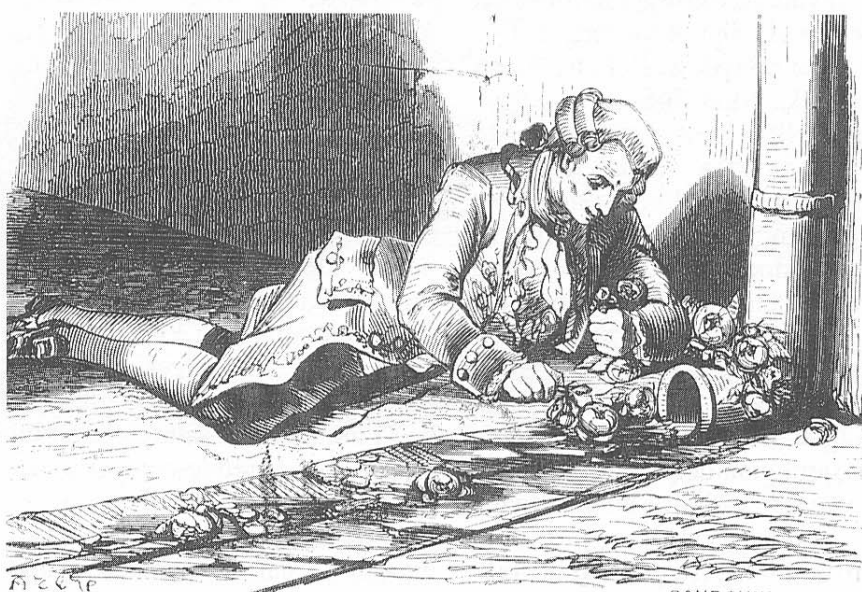
Marquis de Sade i fængslet. Illustration fra bogen "Marquis de Sade".