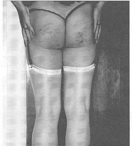
Billet mrk. 01107

Hvor mine grænser går, håber jeg at vi kan finde ud af i fællesskab.