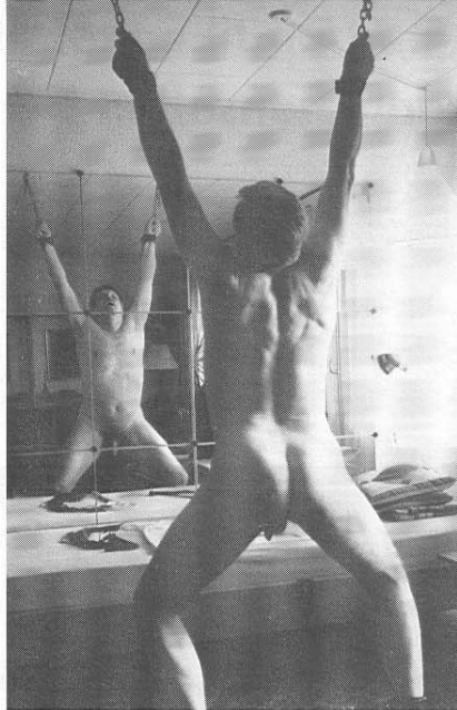
Billet mrk. 01106

Jeg er motiveret imod S og M med det almindelige udstyr og udfoldelser i form af tvang, bondage, ydmygelse, spanking mm.