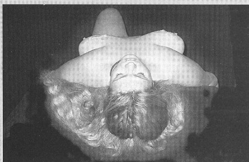
Brændende kærlighed s.35 - leg med stearin